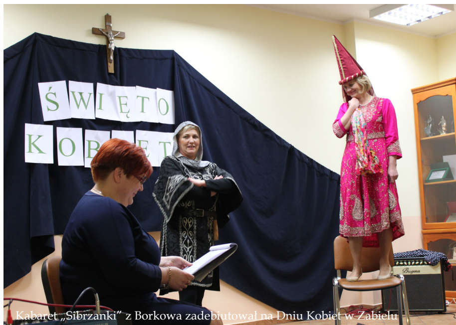
Kabaret „Sibrzanki” z Borkowa zadebiutował na Dniu Kobiet w Zabielu