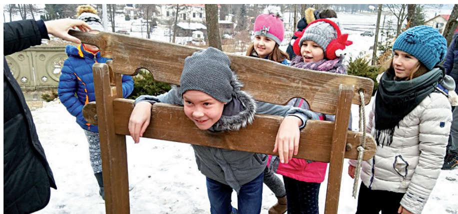
FERIE W BIBLIOTECE TO M.IN. WYCIECZKA DO MIKOŁAJEK I NA ZAMEK W RYNIE

31 stycznia młodzież z terenu gminy Kolno mogła realizować się poprzez zajęcia sportowo – rekreacyjne na lodowisku, a także doznać wrażeń artystycznych w trakcie projekcji filmu „Po prostu przyjaźń” w kinie „Helios” w Białymstoku. Do nieco młodszych uczniów skierowany był wyjazd do Zamku Krzyżackiego w Rynie oraz Parku Wodnego Tropikana w Mikołajkach, który biblioteka zorganizowała 2 lutego przy współpracy ze Szkołą Podstawową im. Marszałka Józefa Piłsudskiego w Czerwonem. W międzyczasie, bo 1 lutego, najmłodszy czytelnicy biblioteki bawili się na „Karnawałowym balu baśni”. Dziewczęta działające w Dyskusyjnym Klubie Książki przygotowały dla nich wiele atrakcji. Były zagadki, mini konkursy i rebusy literac-