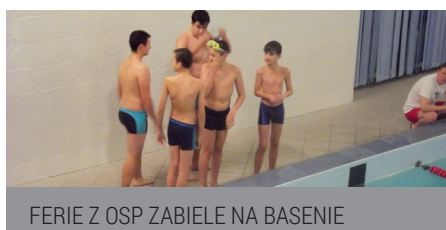
FERIE Z OSP ZABIELE NA BASENIE

Strażacy z OSP Zabiele zadbałi o to, by w ferie członkowie młodzieżowej drużyny mogli aktywnie i pożytecznie spędzić czas. Zorganizowanie m.in. wyjazdu do Mikołajek czy na basen w Kolnie nie byłoby możliwe bez finansowego wsparcia. Jednostka OSP Zabiele otrzymała je ze środków przeznaczonych na