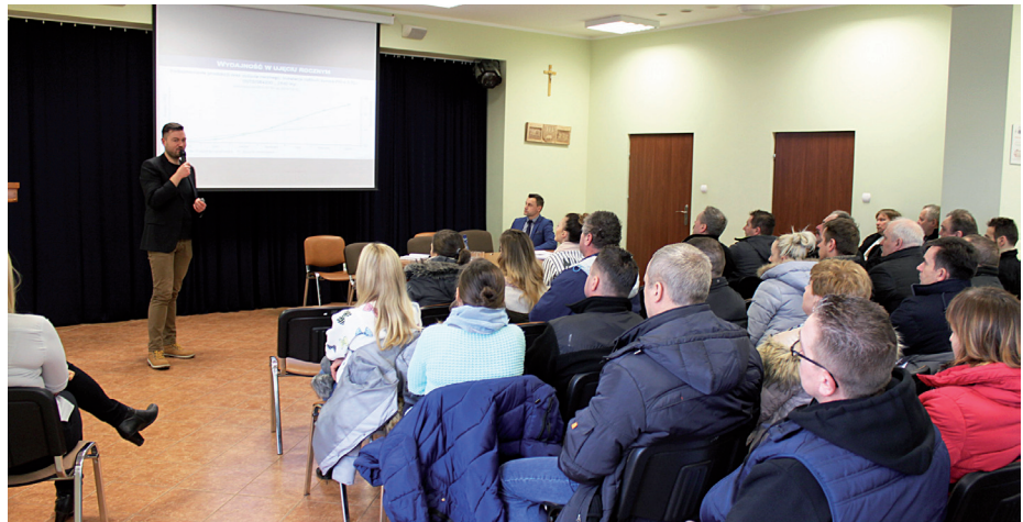
SPOTKANIE DOTYCZĄCE PROJEKTU POZWALAJĄCEGO NA DOFINANSOWANIE BUDOWY INSTALACJI WYKORZYSTUJĄCYCH ODNAWIALNE ŹRÓDŁA ENERGII CIESZYŁO SIĘ SPORYM ZAINTERESOWANIEM MIESZKAŃCÓW GMINY KOLNO

Gmina Kolno przeprowadziła nabór deklaracji mieszkańców Gminy