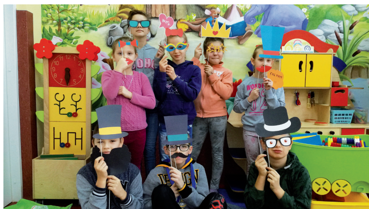
CKGK ORGANIZOWAŁO FERIE NIE TYLKO W ŚWIETLICACH, ALE TEŻ W SZKOŁACH. NA ZDJĘCIU DZIECI Z SP JANOWO. WIĘCEJ ZDJĘĆ NA STRONIE CKGK