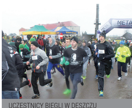
UCZESTNICY BIEGLI W DESZCZU