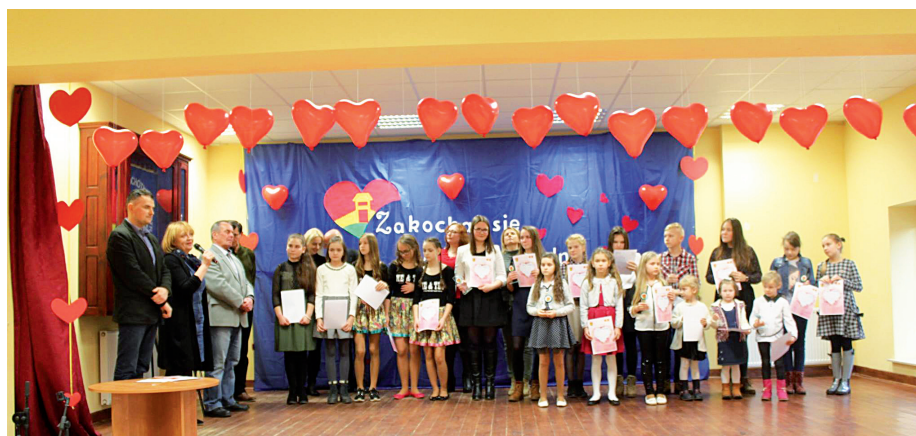
LAUREACI I UCZESTNICY KONKURSU WOKALNEGO „ZAKOCHAJ SIĘ W GMINIE KOLNO”