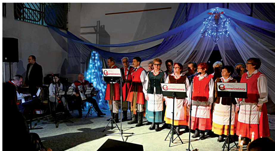
ZESPÓŁ LUDOWY CZERWIENIACY NA EKUMENICZNYM PRZEGLĄDZIE KOLEĐ W BOĆKACH

Zespół Ludowy Czerwieniacy wystąpił w tegorocznej edycji Ekumenicznego Wieczoru Kolęd, który odbywa się w gminie Boćki.