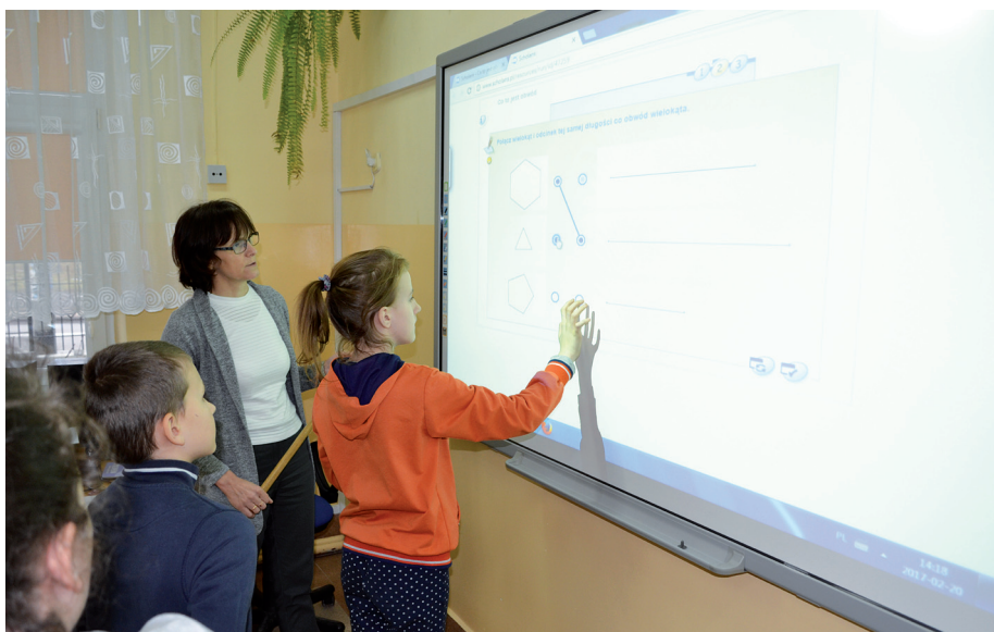
DZIĘKI PROJEKTOWI W ZSS W ZABIELU ODBĘDZIE SIĘ 1656 GODZIN ZAJĘĆ DODATKOWYCH

W Szkole Podstawowej im. Marszałka Józefa Piłsudskiego w Czerwonem w projekcie pt. „Szkola kluczowych możliwości” uczestniczy 52 uczniów. Dzieci mają zajęcia dodatkowe z matematyki, informatyki, z języka angielskiego i przyrody. W projekcie jest też zaplanowane do-