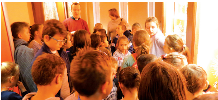
UCZNIOWIE ZE SZKOŁY PODSTAWOWEJ IM. ORŁA BIAŁEGO W WYKOWIE ZWIEDZILI NOWĄ WYSTAWĘ PT. „IDŹCIE I GŁOŚCIE” W MUZEUM DIECEZJALNYM W ŁOMŻY

Mając trochę czasu, poszliśmy do Kościoła Braci Kapucynów, aby tam obejrzeć ruchomą szopkę betlejemską. Dzieci mogły zobaczyć nie tylko Trzech Króli, ale rozpoznać w niej wielu bohaterów narodowych, takich jak Tadeusz Kościuszko czy Józef Piłsudski. Potem udaliśmy się do Muzeum Diecezjalnego, gdzie jako pierwsi mogliśmy obejrzeć