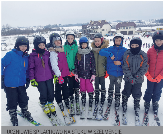
UCZNIOWIE SP LACHOWO NA STOKU W SZELMENCIE