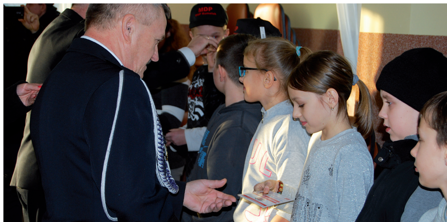
CZŁONKOWIE MDP OSP KUMELSK OTRZYMALI PIERWSZE STRAŻACKIE LEGITYMACJE