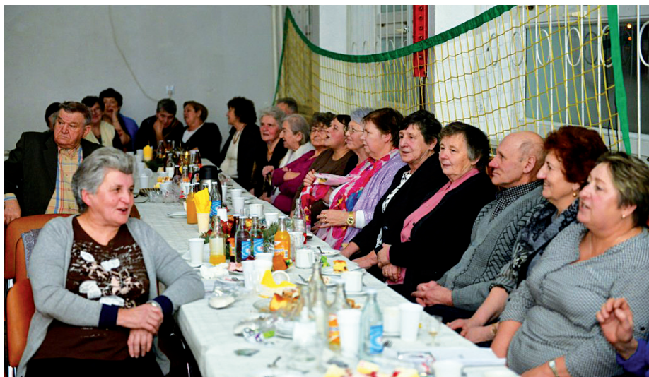
SPOTKANIA Z SENIORAMI W BORKOWIE TO JUŻ TRADYCJA, W TYM ROKU SENIORIADA ODBYŁA SIĘ PO RAZ 6.