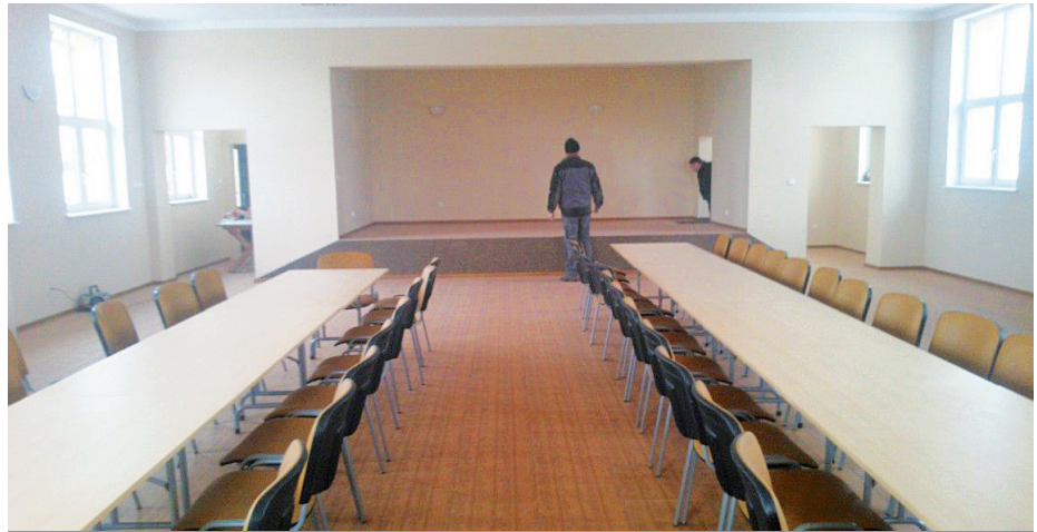
PIERWSZE ZREALIZOWANE ZADANIE W RAMACH FUNDUSZU SOŁECKIEGO NA 2017 R. TO REMONT ŚWIETLICY WIEJSKIEJ W JANOWIE

Przebudowy i zwirowanie dróg oraz utwardzanie poboczy to najczęściej wybierane zadania do re-